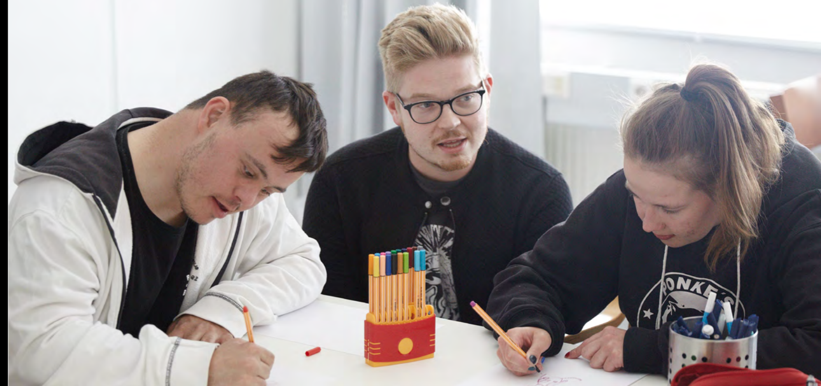
■ Piirustukset saavat väriä pintaan Espoon päiväaikaisessa toiminnassa.