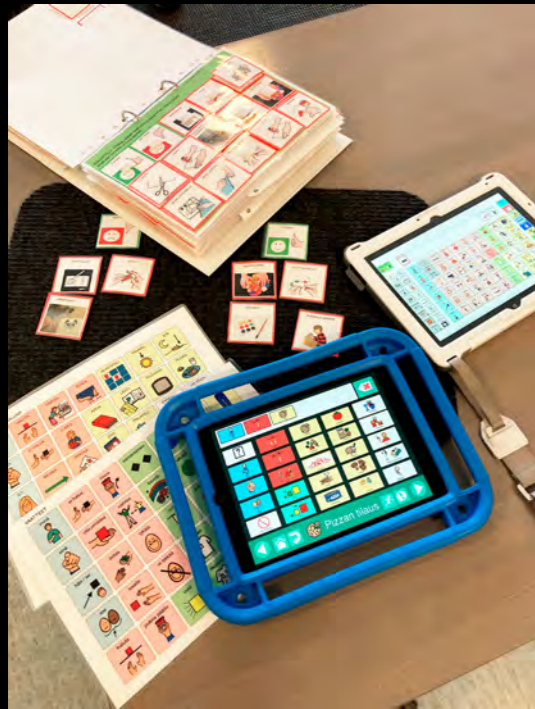
■ Kommunikointiin on saatavilla monenlaisia apukeinoja.

ETEVA ALUEELLA työskentelee kuusi AAC-ohjaajaa, joihin voi olla yhteydessä aina, kun tarvitaan apua kommunikoinnin apuvälineisiin, kommunikointiin tai vuorovaikutukseen liittyen. AAC tulee sanoista Augmentative and Alternative Communication. Suomessa tästä käytetään nimitystä puhetta tukeva ja korvaava kommunikointi. Vaihtoehtoiset kommunikointimenetelmät nimestä on luovuttu jo vuosia sitten, koska puhevammaiselle apuvälineen käyttö ei ole vaihtoehto, vaan välttämätöntä, eikä KELA korvaa vaihtoehtomenetelmiä.