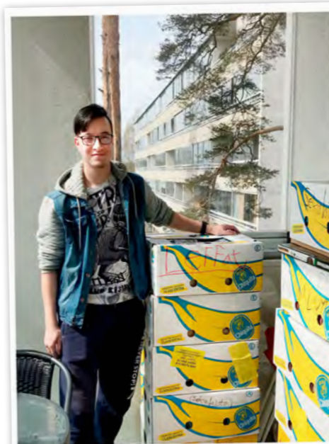
■ Esalla on muuttolaatikat pakattuna.

Teksti Tiina Roikonen