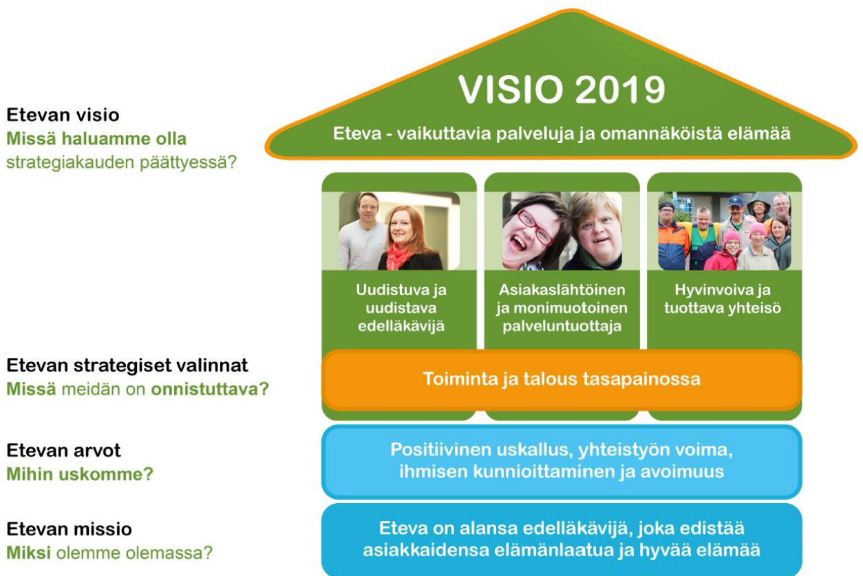
Kuva 1. Etevan strategiatalo.

Etevassa asiakas saa korkeatasoista ja turvallista palvelua. Henkilöstö mahdollistaa osaltaan asiakkaalle hyvän elämän. Asiakslähtöinen palvelu syntyy ihmisen kunnioittamisesta ja ammattitaidosta, ja se perustuu luottamukseen ja asiakkaan tarpeisiin. Asiakas ja hänen läheisensä ovat mukana suunnittelemassa ja arvioimassa palvelua. Toimintaa arvioidaan ja kehitetään suunnitelmallisesti, ja palautteet ovat osa toiminnan kehittämistä.