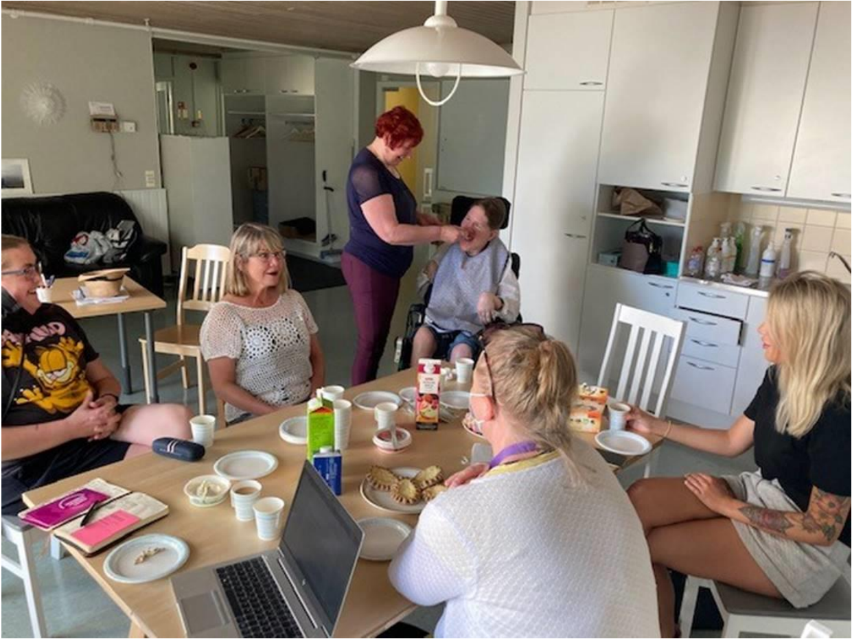
Kuva 3. Tukirinkitapaamisessa on tärkeää kiireetön ja rento tunnelma.

ilmapiirissä ja tilassa. Parhaimmillaan tukirinki tuo myös lisää kontakteja sekä yhteydenpitoa ammattilaisten ja sukulaisten välillä.